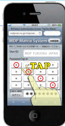
※実際の画面にはパターン○の印は表示されません。

また、認証を文字情報で行わないので個人情報などからパスワードの推測がされにくく、従来の様に文字情報として流出しにくいいため、セキュアな認証環境を実現することができます。