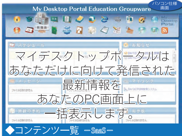
パソコン仕様画面

MDP:マイデスクトップポータルは教育機関に於ける学生及び教職員を含めた多数のユーザーに対して学習、研究支援、コミュニケーション、遠隔授業、外部ネットワークとの情報発信及び情報収集を効率よく提供できる教育現場のために作られた学習支援システムです。